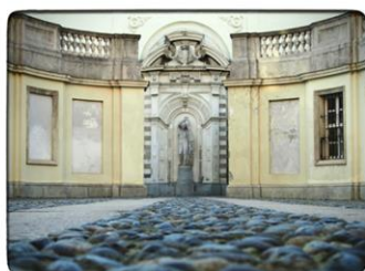
Palazzo Affari, sede degli uffici al pubblico